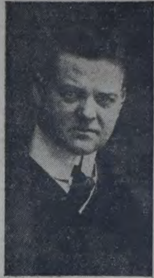
CANDIDATO DEL PARTIDO REPUBLICANO a la presidencia de los Estados Unidos

ta del exceso de la producción y por una tarifa aduanera adecuada, que proteja la producción nacional, por cuanto entiende que una tarifa proteccionista es tan esencial para la agricultura como para la industria.