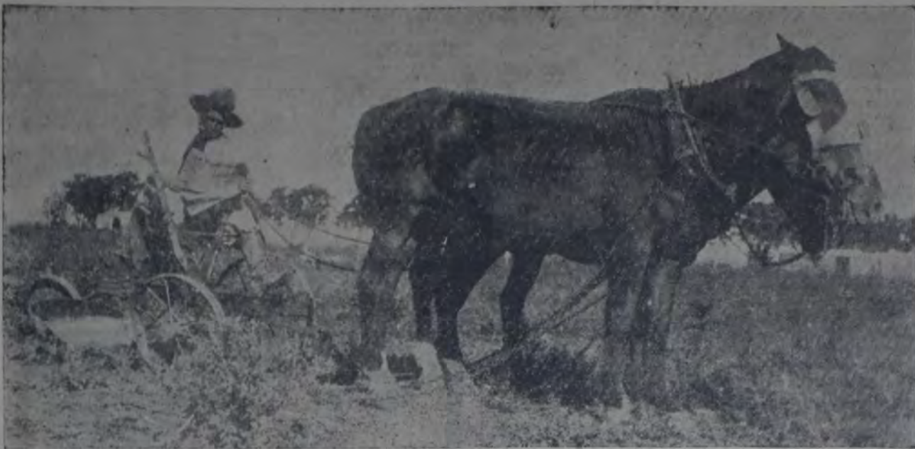
ASI ACONSEJAN LOS AGRONOMOS DEL MINISTERIO DE AGRICULTURA, PERO ¿COMO HABRAN DE CONSEGUIRLO NUESTROS CHACARE...